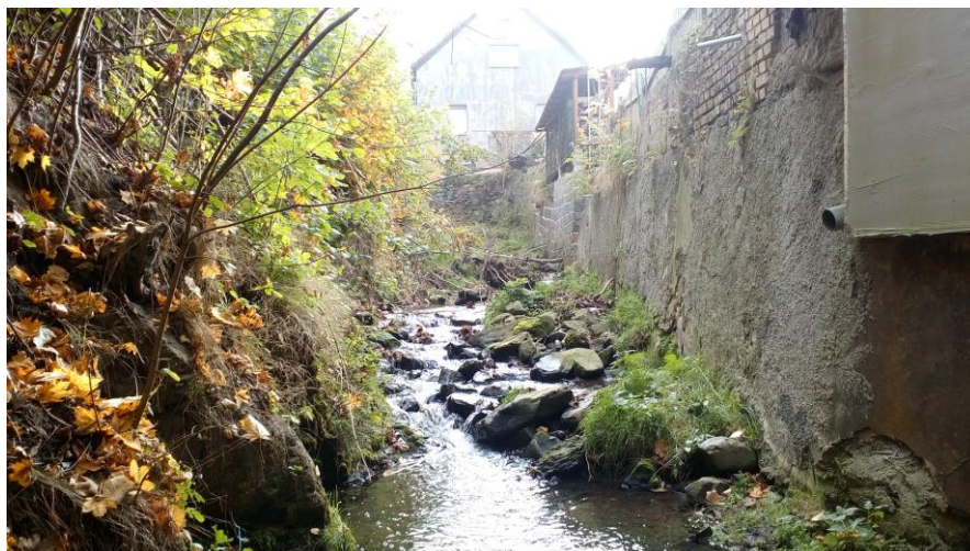
Foto č. 2: Ř.km 0,020, pohled proti směru toku na levobřežní zeď, betonová zeď bude sanována