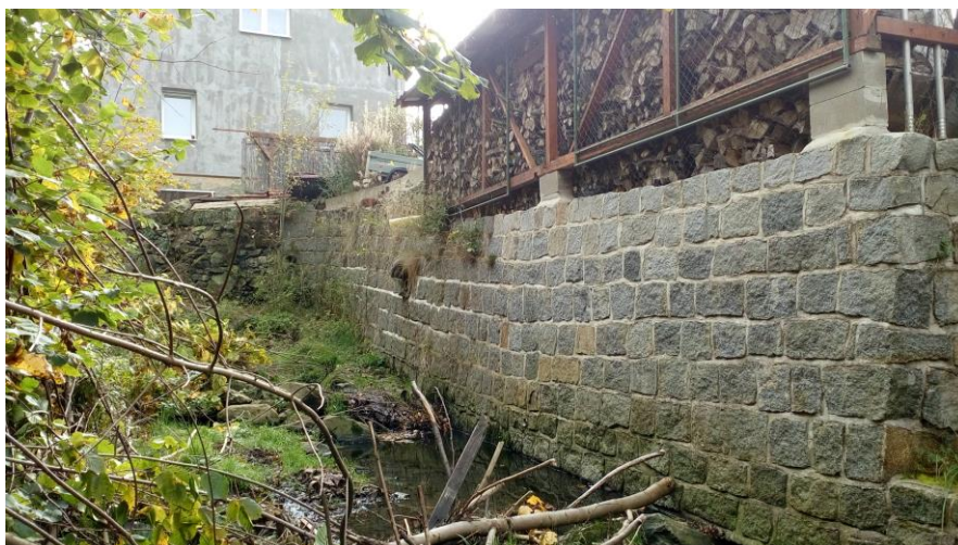
Foto č. 3: Ř.km 0,045, pohled proti směru toku na levobřežní zed', u zdi bude doplněno odvodnění