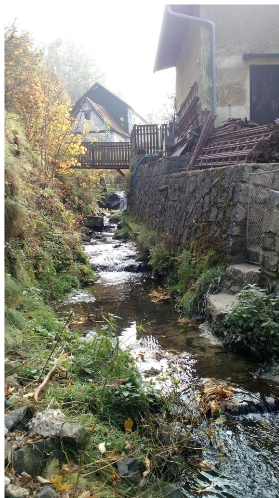
Foto č. 6: Ř.km 0,081, pohled proti toku na levobřežní zeď po opravě, zeď bude přespárována