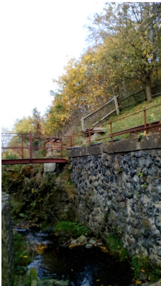
Foto č. 5: Ř.km 0,079, pohled ohled po směru toku na pravobřežní zděnou zeď naproti přístavby. Zeď bude kompletně přezděna.