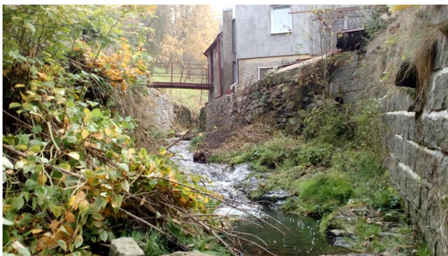
Foto č. 4: Ř.km 0,050, pohled ohled proti směru toku na levobřežní zed', zed' bude vybourána a