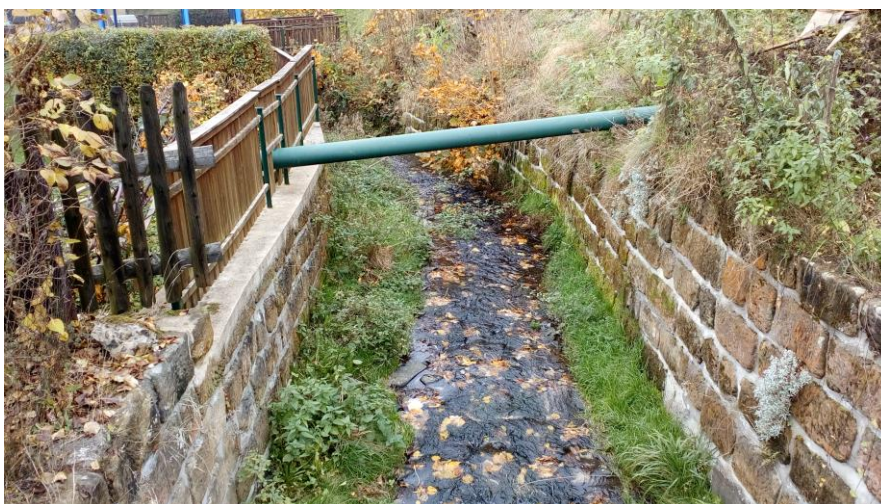
Foto č. 8: Ř.km 0,112, pohled po směru toku na konec úseku, u zdí bude doplněno odvodnění, nános v korytě bude odstraněn